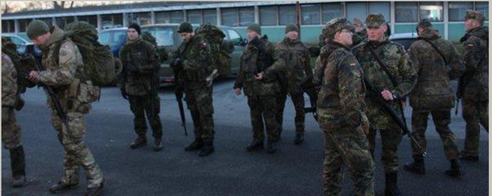
Arkivfoto. Klargøring til turen.